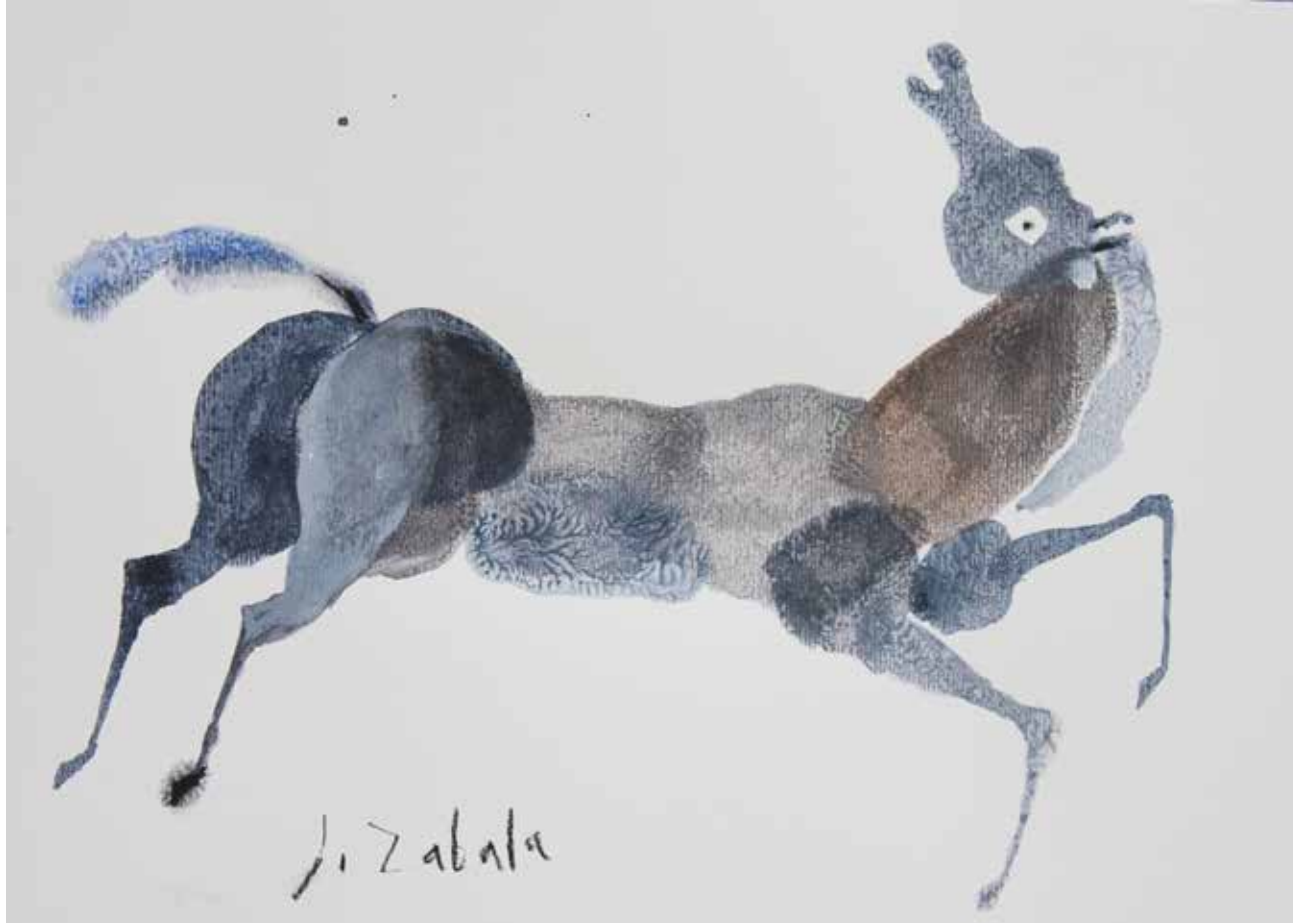
Regalo de Javier Zabala a los alumnos del Máster